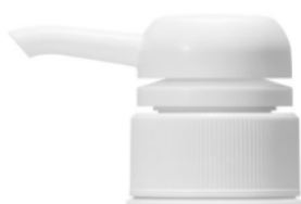
リニューアル前品