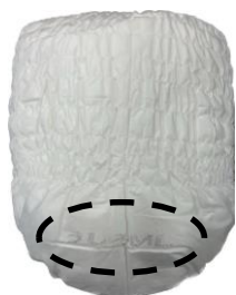
リニューアル前品 うしろ印字